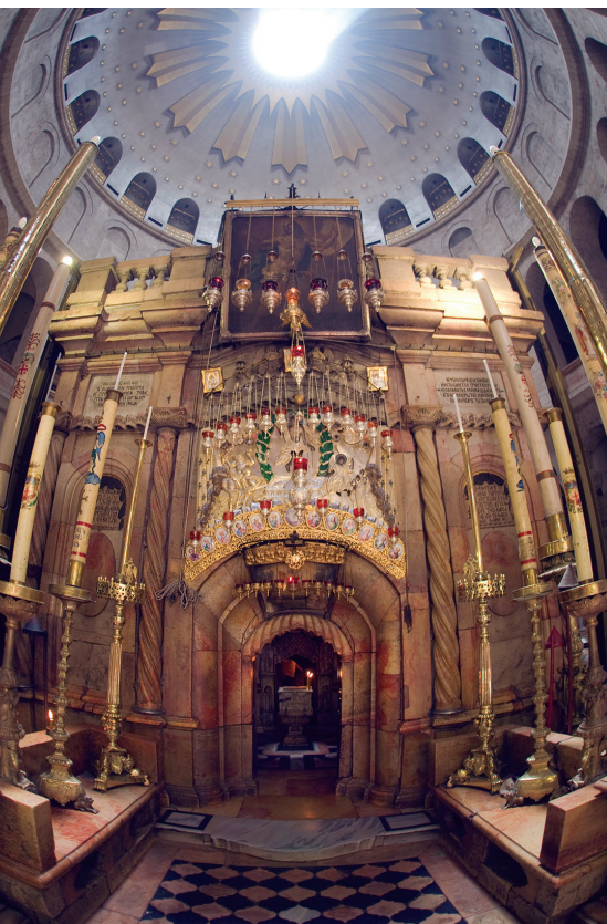
► Iglesia del Santo Sepulcro en Jerusalén, edificada sobre la tumba donde Jesús fue enterrado y resucitó.